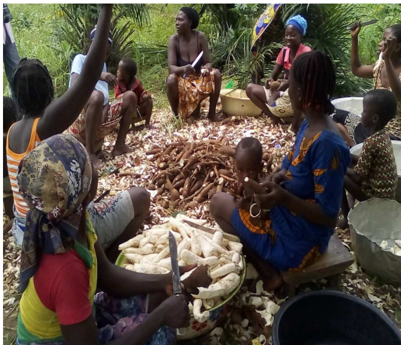
Epulchage de tubercules de manioc

Pour confirmer le travail des femmes et leurs besoins