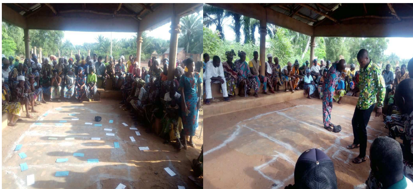
Séances de déclenchement des adultes

Voici quelques images qui témoignent l'effectivité de ces séances de déclenchements :