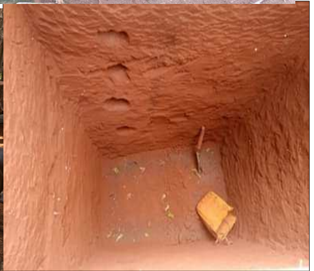
Fouilles en cours de réalisation