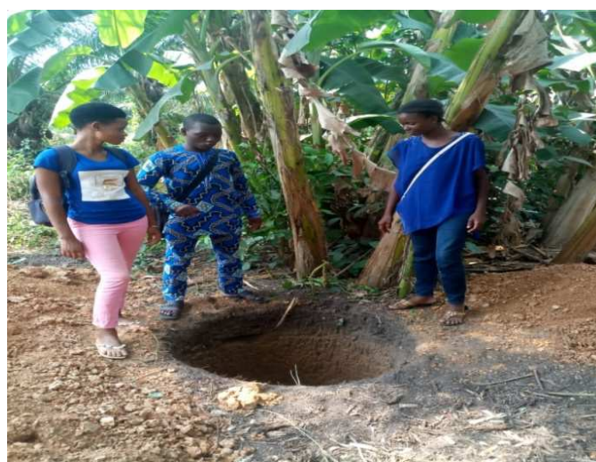
Fouilles en cours de réalisation