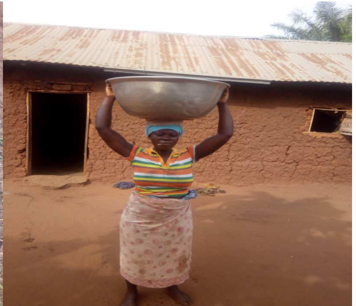
Moyen de transport non conventionnel

Suite à une analyse minutieuse des constats au cours des visites de terrain, le choix a été porté sur les villages de deux arrondissements à savoir : Zoungbomè et Gomè-sota, sous le contrôle de la mairie pour la mise en œuvre de l'ATPC.