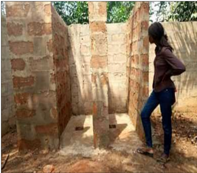
Latrine avec superstructure en cours de réalisation