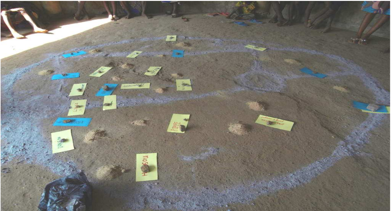
Carte communautaire comportant des infrastructures, des habitations et des zones